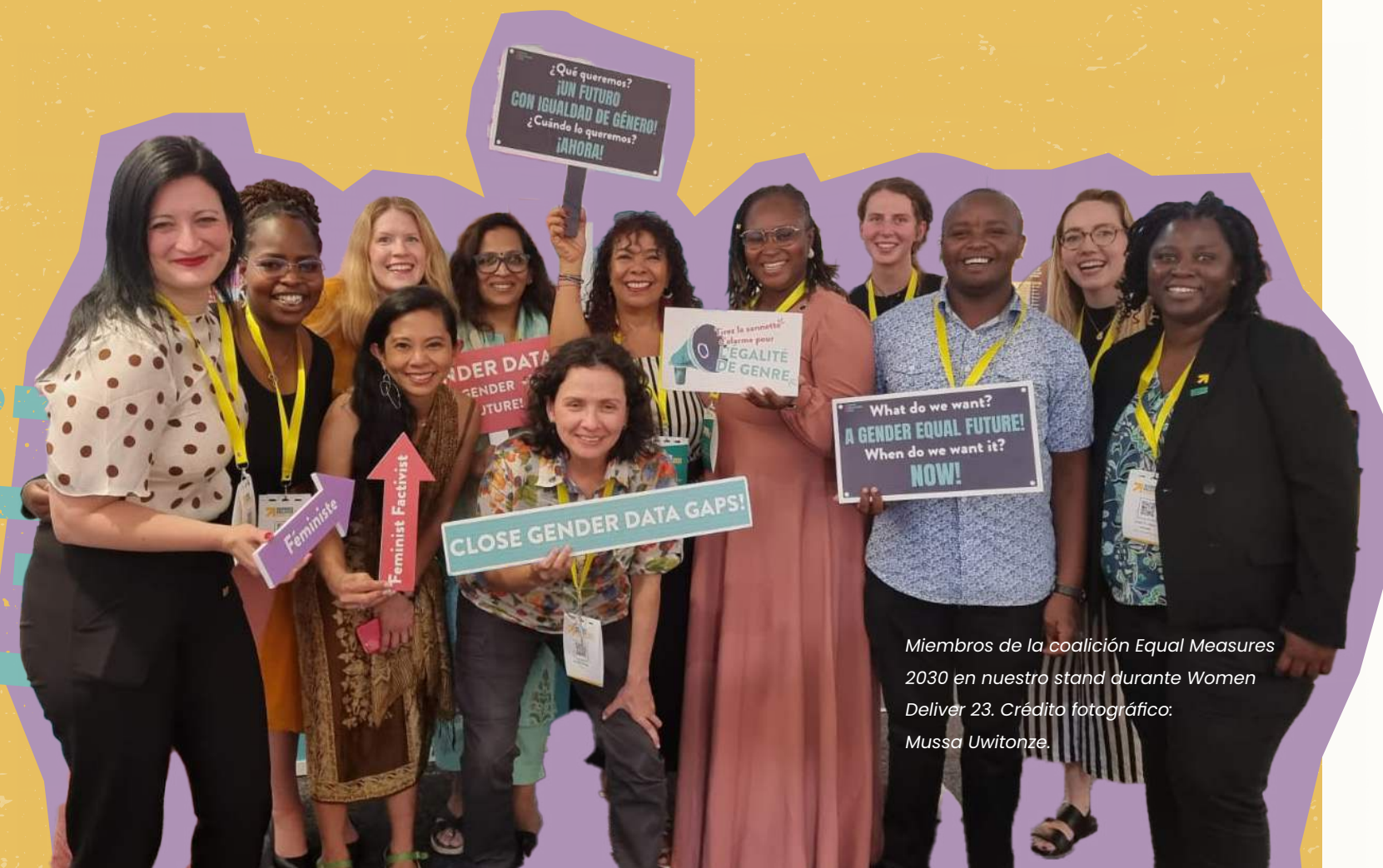
Miembros de la coalición Equal Measures 2030 en nuestro stand durante Women Deliver 23.

En vista de las dificultades a las que se enfrenta el activismo por la igualdad de género en todo el mundo, y a fin de garantizar nuestra disposición y coordinación para impulsar un cambio positivo dondequiera que se encuentre, en 2023 resolvimos que el modelo de EM2030 debía evolucionar hacia una coalición que realmente abarcara los ámbitos mundial y local. El nuevo modelo de coalición de EM2030 une a activistas basados en datos que luchan por la igualdad de género en diferentes contextos.