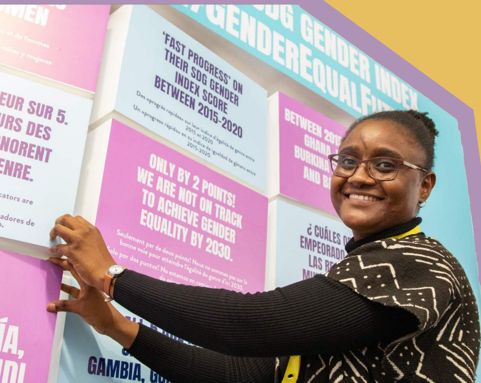
Un participante interactúa en el stand de Equal Measures 2030 durante Women Deliver 23.

Presentaremos el Índice de Género de los ODS de 2024 antes de que las Naciones Unidas celebren la Cumbre del Futuro en septiembre. Para adaptarse al cambiante panorama de los datos de género, el nuevo Índice se está renovando. Los miembros de la coalición ya están colaborando para elaborar planes sobre cómo comunicar los resultados del Índice y lograr con ello el máximo impacto.